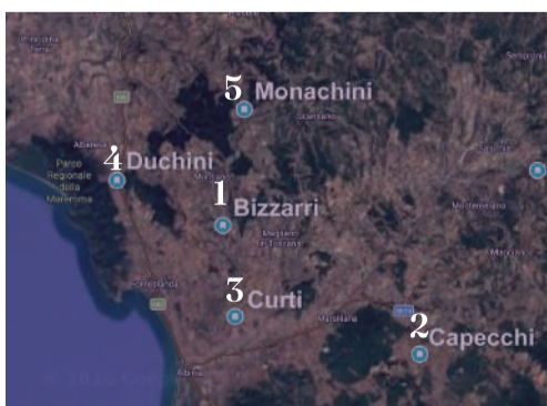
Dati di FoodMicroTeam e Fondazione per il Clima e la Sostenibilità.